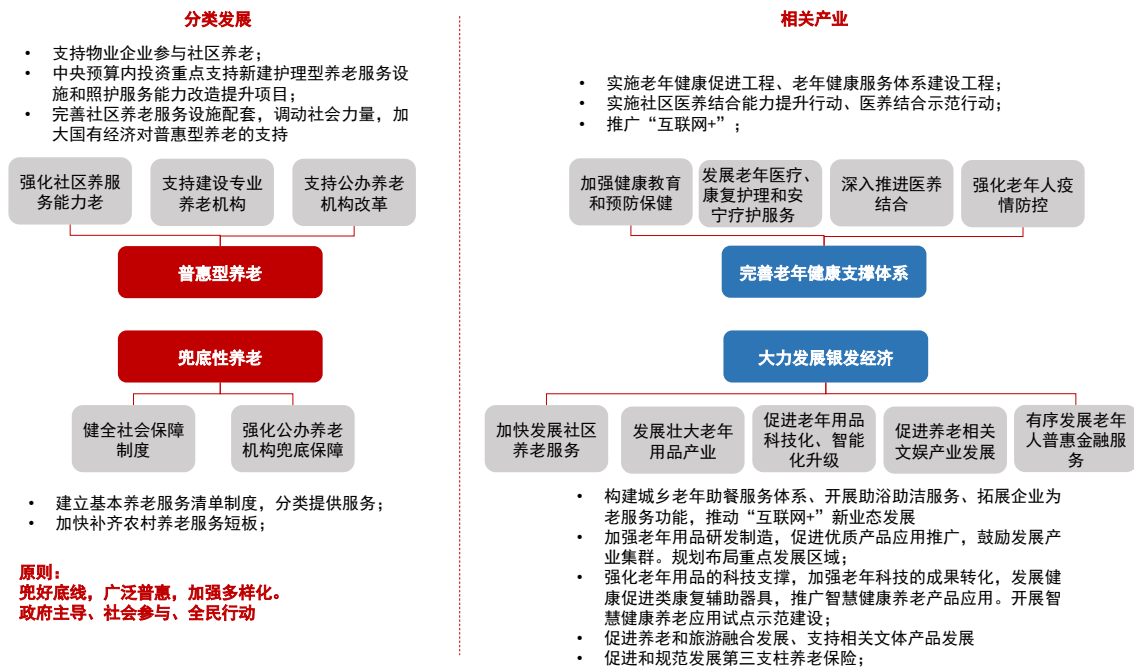
图1 “十四五”国家老龄事业发展和养老服务体系规划

普惠型养老与财政兜底的基本养老、完全市场化的高端养老相比，更加强调构建一种面向社会大众、主要依靠市场供给且受一定政策限制的养老服务体系。普惠型养老，需要充分调动社会力量，才能满足体量巨大的资金缺口和养老需求，包括公建公营、公建民营、民建民营，其中， 公建民营是主要形式 。在实现路径上，以居家养老为基础，通过新建、改造、租赁等方式，支持在社区开辟空间开展养老服务，提升社区养老服务能力，进一步探索“社区+物业+养老”模式；通过直接建设、委托运营、购买服务、鼓励社会投资等多种方式发展机构养老。此外，公办养老机构正在改革，提升服务质量，有条件的地方已探索设立养老服务产业发展基金，引导国有资本、社会资本等广泛参与发展养老服务业。